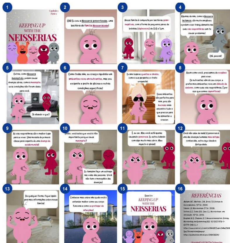
Figura 2 Exemplos de postagens do Adote uma Bactéria 2024, grupo Neisseria

Neste estudo, foram utilizadas postagens produzidas em 2024 na atividade “Adote uma Bactéria” — aprovado pelo Comitê de Ética em Pesquisa com Seres Humanos (CEPSH ICB-USP — sob o número de protocolo CAAE 51764021.0.0000.5467), desenvolvida durante a disciplina de Bacteriologia do curso de Ciências Biomédicas da Universidade de São Paulo. Para a validação da plataforma Conecta#Adote, dentre os cinco grupos participantes da atividade foram selecionadas apenas as postagens do grupo Neisseria , composto por nove alunos de graduação. As postagens foram coletadas manualmente a partir do perfil oficial da atividade no Instagram® (Figura 2), utilizando o acesso institucional ( login e senha). Cada publicação foi salva individualmente no formato de imagem e, em seguida, transferida para o ambiente da plataforma, simulando o processo original de postagem. Essa abordagem buscou reproduzir fielmente a dinâmica de uso do sistema, assegurando condições reais de interação e análise. O conjunto resultante foi utilizado como base para testar as funcionalidades de organização, armazenamento e análise automatizada de dados acadêmicos, permitindo validar o desempenho e a aplicabilidade da plataforma no contexto educacional.