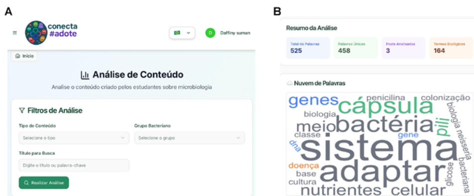
Figura 5 Interfaz del área de análisis de la plataforma Conecta#Adote.

Nota. Elaborado por los autores (2026). [A] Módulo de Análisis de Contenido, donde el usuario selecciona el tipo de publicación, el grupo bacteriano adoptado y el título deseado para iniciar el procesamiento automático. [B] Ejemplo de análisis aplicado a publicaciones de la actividad “Adopta una Bacteria” en la plataforma. Se evaluaron tres publicaciones del grupo Neisseria , con un total de 525 palabras, de las cuales 458 fueron únicas y 164 términos biológicos identificados. La nube de palabras resalta los conceptos más recurrentes presentes en las publicaciones.